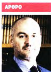
Του Αθανασίου Σαββάκη

Είναι γνωστό ότι την τελευταία δεκαετία το επενδυτικό κενό που έχει καταγραφεί στη χώρα μας ανέρχεται στο ιλιγγιώδες ποσό του σχεδόν ενός ΑΕΠ της χώρας: 162 δισ. ευρώ. Άρα, τα 32 δισ. ευρώ του Ταμείου μόνο ένα μέρος αυτού του σημαντικού κενού μπορούν να καλύψουν. Για το λόγο αυτό ο ΣΒΕ υποστηρίζει ότι με έναν μέσον όρο περίπου 3,2 δισ. ευρώ τα οποία θα διοχετευθούν στην ελληνική οικονομία μέσω του Ταμείου Ανάκαμψης από το 2021 έως και το 2025, το μοναδικό ερώτημα που τίθεται είναι με ποιον τρόπο η κυβέρνηση θα μπορέσει να άρει τις αμφιβολίες και των πλέον δύσπιστων, εν προκειμένω των θεσμών και των διεθνών οργανισμών, ότι πράγματι τα συγκεκριμένα κονδύλια θα εξασφαλίσουν τη βιώσιμη ανάπτυξη στη χώρα την επόμενη δεκαετία. Με βάση τα παραπάνω ο Σύνδεσμος Βιομηχανιών Ελλάδος (ΣΒΕ) υποστηρίζει ότι οι κάθε είδους επενδύσεις, αλλά ειδικά οι παραγωγικές επενδύσεις που θα χρηματοδοτηθούν από το Ταμείο Ανάκαμψης, είναι αυτές που θα τοποθετήσουν τη χώρα μας εκ νέου στις ανεπτυγμένες χώρες του δυτικού κόσμου. Για να γίνει όμως αυτό χρειάζεται να δώσουμε ιδιαίτερη προσοχή στην άρση των παθογενειών του παρελθόντος. Παθογένειες που σχετίζονται ευθέως με την «κατεύθυνση» των κονδυλίων για την επίτευξη της ανάπτυξης της χώρας.