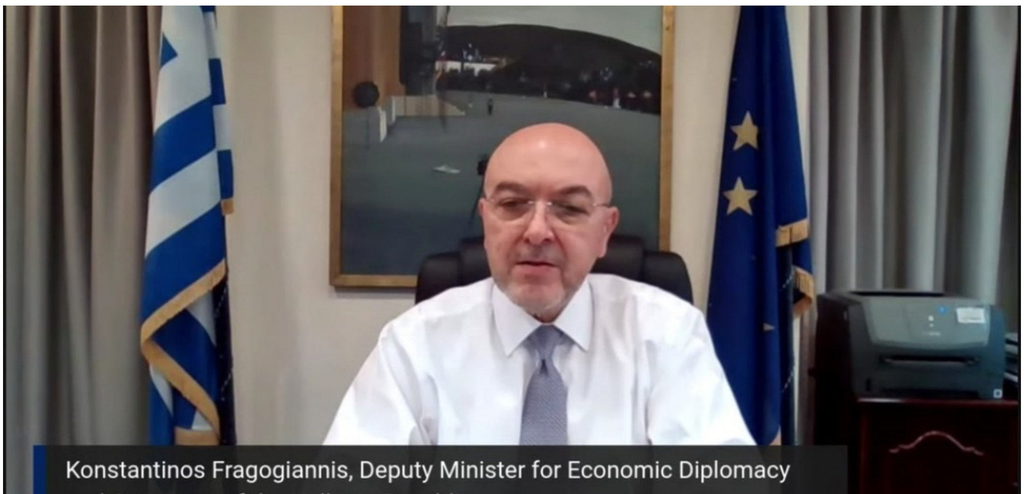
Konstantinos Fragogiannis, Deputy Minister for Economic Diplomacy