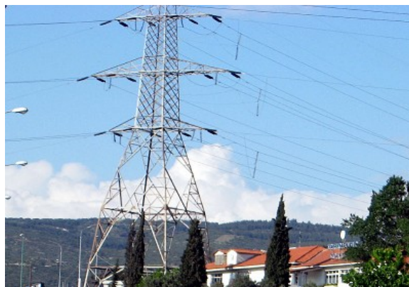
Ειδήσεις - Ελλάδα - Κόσμος