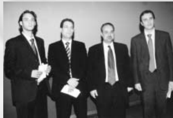
Ο Πρόεδρος κ. Γ. Μυλωνάς στην απονομή του τρίτου βραβείου

επιδιώξουμε η πρωτοβουλία αυτή να γίνει θεσμός στην Περιφέρεια Κεντρικής Μακεδονίας, αλλά θα καταβάλλουμε κάθε δυνατή προσπάθεια ούτως ώστε να καθιερωθεί και στις υπόλοιπες τρεις περιφέρειες του Βορειοελλαδικού Τόξου».