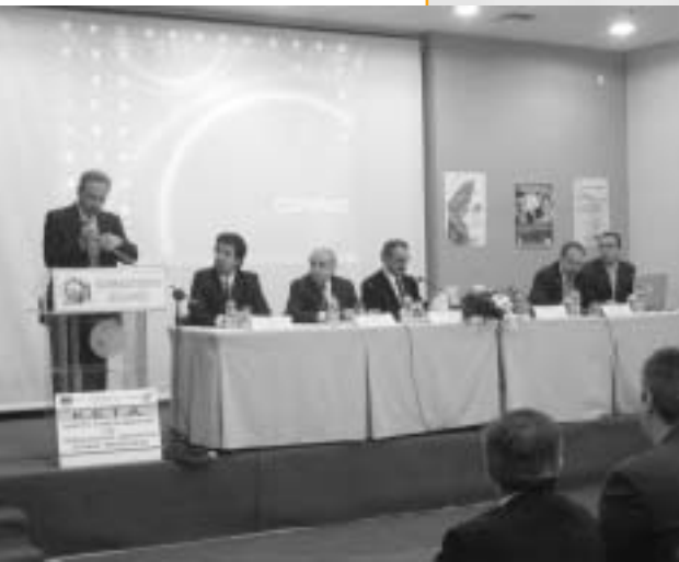
Στιγμιότυπο από τη συνάντηση

Μ ε στόχο την κινητοποίηση του τοπικού επιχειρηματικού δυναμικού για την ενίσχυση της επιχειρηματικότητας στην Δυτική Μακεδονία, ο Σύνδεσμος Βιομηχανιών Βορείου Ελλάδος (Σ.Β.Β.Ε) και το Κέντρο Επιχειρηματικής και Τεχνολογικής Ανάπτυξης (Κ.Ε.Τ.Α) Δυτικής Μακεδονίας - ANKO Α.Ε. διοργάνωσαν, στο Εκθεσιακό Κέντρο Δυτικής Μακεδονίας, στα Κοίλα Κοζάνης, ημερίδα με θέμα: «Ανάπτυξη της Επιχειρηματικότητας στη Δυτική Μακεδονία».