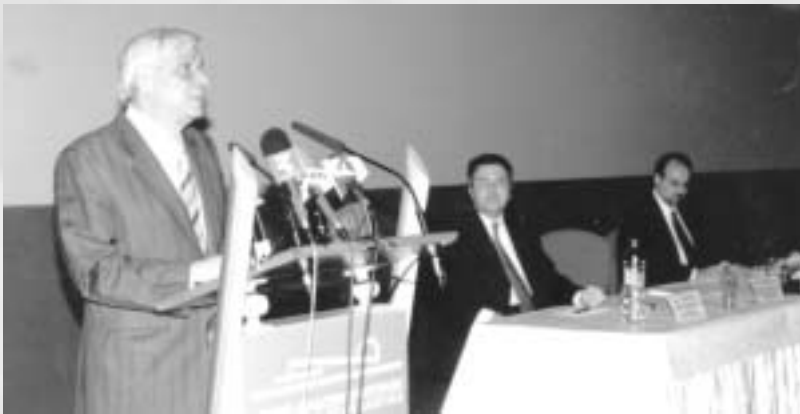
Ο Υπουργός κ. Πρ. Παυλόπουλος στο βήμα της εκδήλωσης

Στο πλαίσιο του εορτασμού των 90 χρόνων από την ίδρυση του ΣΒΒΕ, η Περιφέρεια Κεντρικής Μακεδονίας και ο Σύνδεσμος Βιομηχανιών Βορείου Ελλάδος, διοργάνωσαν εκδήλωση τελετής «Βράβευσης Καινοτόμων Επιχειρηματικών Σχεδίων στην Περιφέρεια Κεντρικής Μακεδονίας».