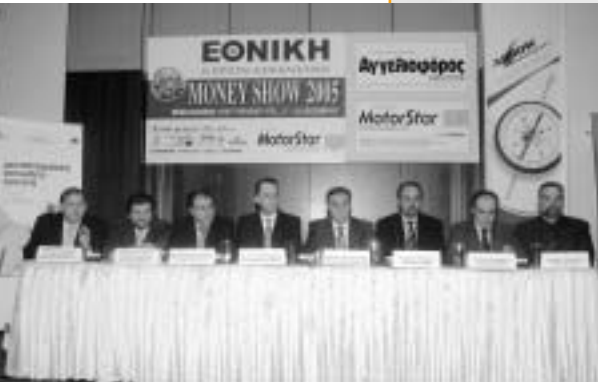
Στιγμιότυπο από την εκδήλωση