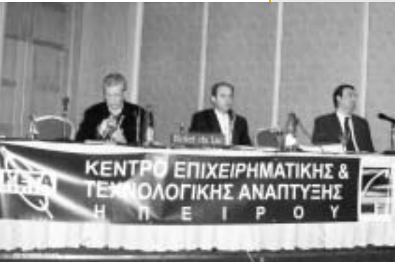
Στιγμιότυπο από την εκδήλωση

Η Ιδιαίτερα χαμηλό κατά κεφαλήν ΑΕΠ (4.000 ευρώ κάτω από τον μέσο εθνικό όρο), υψηλή μακροχρόνια ανεργία (έως και 56,8% το 2002), μείωση πληθυσμού, περιορισμένη βιομηχανία και μεγάλη εξάρτηση από τον πρωτογενή τομέα, εξακολουθεί να παρουσιάζει η Ήπειρος.