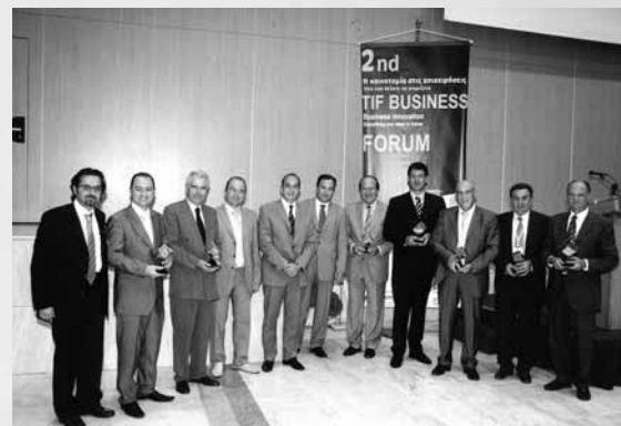
Στιγμιότυπο από τη βράβευση των επιχειρήσεων

Στην τέταρτη και τελευταία ενότητα, με θέμα «Η καινοτομία στην Πράξη: Case Studies από 7 επιχειρήσεις της περιοχής που εφάρμοσαν καινοτομικά σχέδια» και συντονιστή τον Εκτελεστικό Αντιπρόεδρο του ΣΒΒΕ κ. Γιάννη Σταύρου παρουσιάστηκαν και βραβεύτηκαν από τη Helexpro