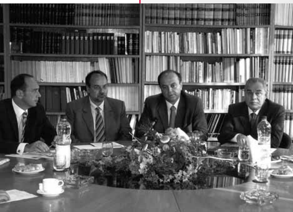
Διακρίνονται από αριστερά οι κ.κ. Γ. Σταύρου, Εκτελεστικός Αντιπρόεδρος ΣΒΒΕ, Γ. Μυλωνάς, Πρόεδρος ΣΒΒΕ, Σ. Τσιτουρίδης, Υπουργός Απασχόλησης & Κοινωνικής Προστασίας και Γ. Γιακουμάτος, Υφυπουργός Απασχόλησης

Η συνάντηση της Διοίκησης του ΣΒΒΕ με τον Υπουργό Απασχόλησης και Κοινωνικής Προστασίας κ. Σάββα Τσιτουρίδη, πραγματοποιήθηκε το Σάββατο 9 Σεπτεμβρίου, στα γραφεία του Συνδέσμου. Στη συνάντηση συμμετείχαν επίσης ο Υφυπουργός Απασχόλησης κ. Γεράσιμος Γιακουμάτος, οι Γενικοί Γραμματείς του Υπουργείου Απασχόλησης