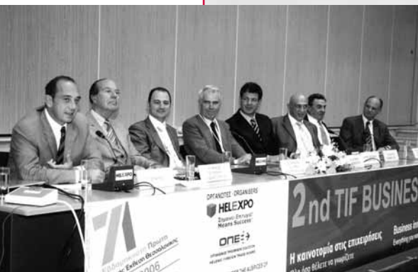
Στιγμιότυπο από το 4ο πάνελ του Forum με θέμα «Η καινοτομία στην Πράξη: Case Studies από 7 επιχειρήσεις της περιοχής που εφάρμοσαν καινοτομικά σχέδια»

Το 2ο Business Forum, που ήταν αφιερωμένο στην καινοτομία, πραγματοποιήθηκε στο πλαίσιο της 71ης ΔΕΘ, τη Δευτέρα 11 και την Τρίτη 12 Σεπτεμβρίου 2006. Συνδιοργανώθηκε από τη Helexpro και τον ΟΠΕ υπό την αιγίδα του Υπουργείου Οικονομίας και Οικονομικών και με την υποστήριξη του Σ.Β.Ε και του CEDEFOP.