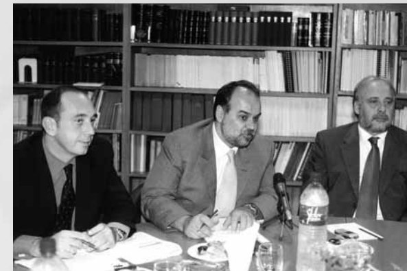
Διακρίνονται από αριστερά οι κ.κ. Γ. Σταύρου, Εκτελεστικός Αντιπρόεδρος ΣΒΒΕ, Γ. Μυλωνάς, Πρόεδρος ΣΒΒΕ και ο Υπουργός Μακεδονίας Θράκης κ. Γιώργος Κаланτζής

σιαστικές αρμοδιότητες στο Υπουργείο Μακεδονίας – Θράκης, υλοποιώντας με αυτόν τον τρόπο την προδιέταξη δέσμευση του ίδιου του Πρωθυπουργού για την αναβάθμιση του ρόλου του Υπουργείου στην περιοχή και την ουσιαστική συμμετοχή του στην υλοποίηση της εθνικής πολιτικής περιφερειακής ανάπτυξης. ♦