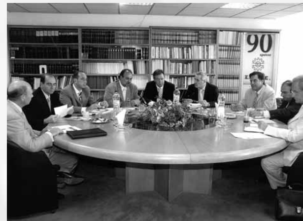
Στιγμιότυπο κατά τη διάρκεια της συνάντησης με τον Υφυπουργό Αγροτικής Ανάπτυξης & Τροφίμων κ. Αλέξανδρο Κοντό

Σκοπός της συνάντησης του Υφυπουργού Αγροτικής Ανάπτυξης και Τροφίμων κ. Αλέξανδρου Κοντού με τη Διοίκηση του ΣΒΒΕ, η οποία πραγματοποιήθηκε την Παρασκευή 8 Σεπτεμβρίου, στα γραφεία του Συνδέσμου, ήταν η συζήτηση επί θεμάτων ανταγωνιστικότητας των επιχειρήσεων μεταποίησης αγροτικών προϊόντων.