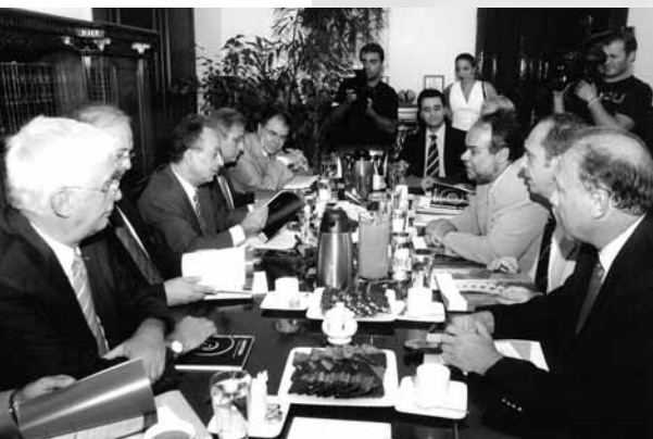
Στιγμιότυπο κατά τη διάρκεια της συνάντησης με τον Υπουργό Ανάπτυξης κ. Δημήτρη Σιούφα.

Την Πέμπτη 7 Σεπτεμβρίου, πραγματοποιήθηκε συνάντηση του Υπουργού Ανάπτυξης κ. Δημήτρη Σιούφα, με τη Διοίκηση του ΣΒΒΕ, στο Υπουργείο Μακεδονίας – Θράκης.