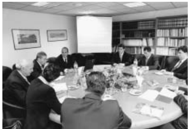
Στιγμιότυπο από τη συνάντηση

Η εκτενής αναφορά που αφορούσε την παρουσία των ελληνικών επιχειρήσεων στα Βαλκάνια περιελάμβανε τη θέση της Ελλάδας ως χώρας από την οποία προέρχονται ξένες άμεσες επενδύσεις, η εξέλιξη των ελληνικών εξαγωγών προς τις χώρες αυτές, κα. ♦