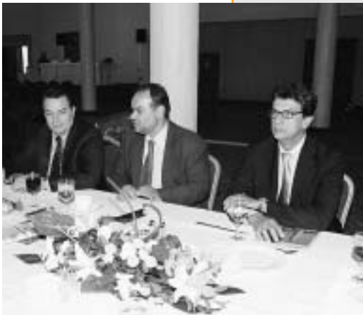
Ο Πρόεδρος κ. Γ. Μιλωνάς με τον Υφυπουργό Εξωτερικών κ. Ε. Στυλιανίδη και τον Γενικό Γραμματέα της Περιφέρειας Ανατολικής Μακεδονίας – Θράκης κ. Μ. Αγγελόπουλο

Αν τα παραπάνω συνδυασθούν με την ύπαρξη και τη δραστηριοποίηση του Δημοκράτειου Πανεπιστημίου, τότε η σύνδεση της έρευνας με την παραγωγή μπορεί να δώσει πολλές νέες επενδύσεις που θα δημιουργήσουν βιώσιμες θέσεις εργασίας στη συγκεκριμένη περιφέρεια. Ακόμη, συζητήθηκε ο νέος ρόλος της Θράκης σε σχέση με την Τουρκία, ως συνδεδεμένου σήμερα και πλήρους μέλους της ΕΕ την επόμενη δεκαετία. Πεποίθηση όλων είναι ότι η Θράκη μπορεί να συμβάλει θετικά στην περαιτέρω σύσφιξη των επιχειρηματικών σχέσεων των δυο χωρών, ενώ το μουσουλμανικό στοιχείο της περιοχής μπορεί να βοηθήσει καταλυτικά προς αυτή την κατεύθυνση. ♦