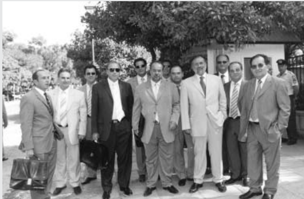
Τα μέλη της Διοίκησης του ΣΒΒΕ κατά την είσοδο τους στο Μέγαρο Μαξίμου

Σύμφωνα με τους Κοινοτικούς Κανονισμούς που θα εφαρμοστούν κατά την επόμενη προγραμματική περίοδο (Δ' Κοινοτικό Πλαίσιο Στήριξης), πέντε (5) από τις δεκατρείς (13) Ελληνικές Περιφέρειες θα τεθούν εκτός Στόχου Ι των παρεμβάσεων των διαρθρωτικών ταμείων. Από τις περιφέρειες της Βόρειας Ελλάδας η Δυτική και η Κεντρική Μακεδονία, παρά την αναπτυξιακή υστέρηση που εμφανίζουν, αποκλείονται από τις χρηματοδοτήσεις του στόχου Ι.