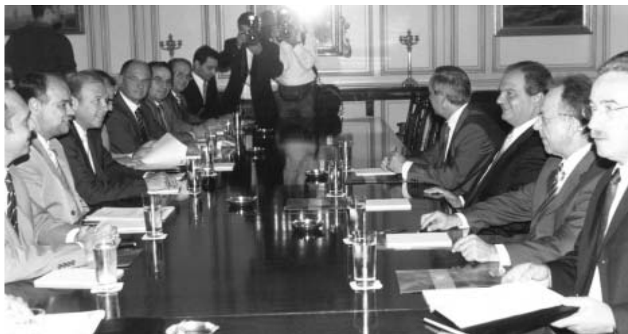
Στιγμιότυπο από τη συνάντηση με τον Πρωθυπουργό

Τέλος, στον επιχειρησιακό σχεδιασμό της δράσης δεν θα πρέπει να επαναληφθούν σφάλματα του παρελθόντος, τα οποία οδήγησαν ανάλογα εγχειρήματα σε κατακερματισμό σε μικρά έργα αμφίβολης αποτελεσματικότητας, γεγονός που δεν οδήγησε σε καμία περίπτωση στην επίτευξη του αρχικού στόχου.