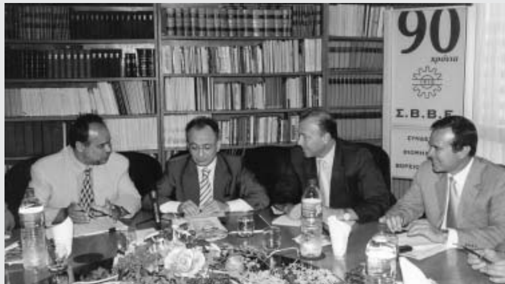
Στιγμιότυπο από τη συνάντηση με τον Υπουργό Ανάπτυξης κ. Δ. Σιούφα. Διακρίνονται από αριστερά οι κ.κ. Γ. Μυλωνάς, Δ. Σιούφας, Ι. Βεργίνης και Β. Τακάς

Ο κ. Υπουργός, για τα περισσότερα από τα ειδικά θέματα που τέθηκαν, δεσμεύθηκε για την επίλυσή τους. Επιπλέον, τόνισε ότι, και με βάση τις Πρωθυπουργικές εντολές, η Βόρεια Ελλάδα θα είναι το κέντρο του «επιχειρείν» για τα επόμενα χρόνια. Τέλος, υπογράμμισε ότι η Κυβέρνηση θα συνεχίσει τη λήψη τολμηρών αποφάσεων για μεταρρυθμίσεις σε όλους τους τομείς, με στόχο την αναγέννηση συνολικά της περιφέρειας. ♦