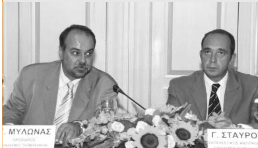
Κατά τη διάρκεια της Συνέντευξης Τύπου που δόθηκε αμέσως μετά τις συναντήσεις με τον Πρωθυπουργό και τον Αρχηγό της Αξιωματικής Αντιπολίτευσης