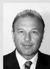
Β' ΑΝΤΙΠΡΟΕΔΡΟΣ Ιωάννης Βεργίνης