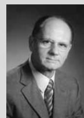
ΓΕΝΙΚΟΣ ΓΡΑΜΜΑΤΕΑΣ Στέφανος Τζιζιότης