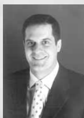
Β' ΑΝΤΙΠΡΟΕΔΡΟΣ Ιωάννης Αναγιάς