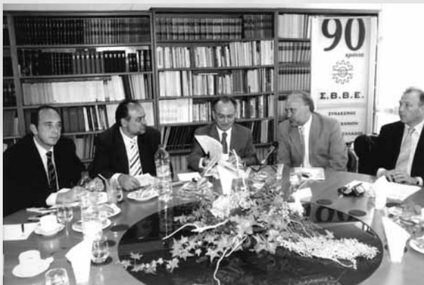
Διακρίνονται από αριστερά ο κ. Γ. Σταύρου, Εκτελεστικός Αντιπρόεδρος ΣΒΒΕ, ο κ. Γ. Μυλωνάς, Πρόεδρος του ΣΒΒΕ, ο κ. Δ. Σιούφας, Υπουργός Ανάπτυξης, ο κ. Γ. Καλαντζής, Υπουργός Μακεδονίας Θράκης και ο κ. Γ. Βεργίνης, Β' Αντιπρόεδρος ΣΒΒΕ

Με τη συμμετοχή του Υπουργού Ανάπτυξης κ. Δ. Σιούφα, πραγματοποιήθηκε Διοικητικό Συμβούλιο του Συνδέσμου, την Παρασκευή 12 Μαΐου 2006.