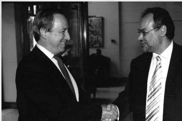
Ο Υπουργός κ. Γ. Αλογοσκούφης με τον Πρόεδρο κ. Γ. Μυλωνά

λύ βασικά για την ανάπτυξη της χώρας και την ενίσχυση της ανταγωνιστικότητας των επιχειρήσεων;