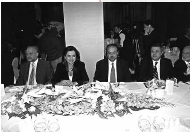
Στιγμιότυπο κατά τη διάρκεια του Δείπνου. Διακρίνονται ο Υπουργός Μακεδονίας Θράκης, κ. Γ. Καλαντζής, η Υπουργός Εξωτερικών, κ. Ντ. Μπακογιάννη, ο Πρόεδρος του ΣΒΒΕ, κ. Γ. Μυλωνάς, ο Γ.Γ. Περιφέρειας Κεντρικής Μακεδονίας, κ. Γ. Τσιότρας και ο Γ.Γ. του Υπουργείου Μακεδονίας Θράκης, κ. Α. Ανανίκας

Ολοκληρώνοντας την ομιλία της η κα Μπακογιάννη τόνισε: «Κατανοούμε απόλυτα, όπως το τόνισα και στην αρχή της ομιλίας μου, τον κρίσιμο οικονομικό, αλλά και πολιτικό, ρόλο που οι ελληνικές επιχειρήσεις παίζουν στην ευρύτερη περιοχή μας. Και θα ήθελα να τελειώσω την ομιλία μου, δίνοντας σε σας, στους εκπροσώπους της ελληνικής επιχειρηματικής κοινότητας του Βορρά, για μια ακόμα φορά, τα θερμά μου συγχαρητήρια για το μεγάλο οικονομικό, αλλά θα έλεγα και εθνικό, έργο που επιτελείτε, απλώνοντας την ελληνική επιχειρηματική ελληνική πρωτοβουλία σ' ολόκληρα τα Βαλκάνια...». ♦