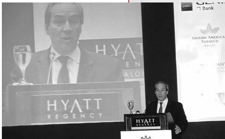
Ο Υπουργός κ. Γ. Αλογοσκouφης στο βήμα κατά τη διάρκεια της ανοιχτής συνεδρίασης

Κυρίες και κύριοι, Κατά τις δύο προηγούμενες Ετήσιες Τακτικές Γενικές Συνελεύσεις του Συνδέσμου Βιομηχανιών Βορείου Ελλάδος είχα την ευκαιρία να παρουσιάσω το νέο αναπτυξιακό πρότυπο που οικοδομεί η Κυβέρνηση από τον Μάρτιο του 2004. Ένα αναπτυξιακό πρότυπο που βασίζεται στο τρίπτυχο: Επιχειρηματικότητα, Εξωστρέφεια, Ανταγωνιστικότητα. Ένα νέο πρότυπο για την Ανάπτυξη, την Απασχόληση και την Κοινωνική Συνοχή. Ανέλυσα τις δράσεις και τις πρωτοβουλίες μας, το μεταρρυθμιστικό μας πρόγραμμα και το σχέδιό μας για την οικονομία της χώρας. Ένα σχέδιο για την αξιοποίηση των συγκριτικών μας πλεονεκτημάτων. Ένα σχέδιο για την αξιοποίηση της στρατηγικής γεωπολιτικής θέσης της χώρας μας. Ένα σχέδιο για να γίνει η Ελλάδα μια δυναμική και σύγχρονη οικονομία. Μια ανταγωνιστική οικονομία. Μια οικονομία γνώσης και ποιότητας, καινοτομίας και προόδου.