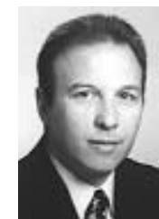
Β' ΑΝΤΙΠΡΟΕΔΡΟΣ Ιωάννης Βεργίνης