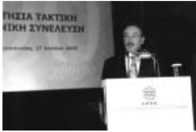
Ο Υπουργός Μακεδονίας Θράκης κ. Ν. Τσιαρτσιώνης

Αξιότιμε κύριε πρόεδρε του ΣΒΒΕ, Εκλεκτοί Παριστάμενοι, Κυρίες και Κύριοι,