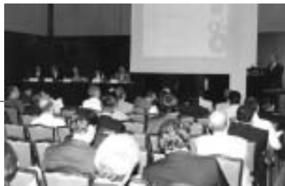
Στιγμιότυπο από την εκδήλωση παρουσίασης των αποτελεσμάτων της έρευνας