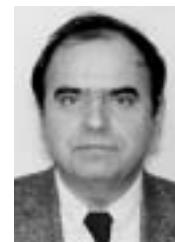
Β' ΑΝΤΙΠΡΟΕΔΡΟΣ Δημήτριος Αμπατζής