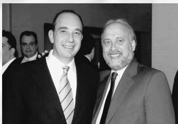
Ο Εκτελεστικός Αντιπρόεδρος του ΣΒΒΕ κ. Γ. Σταύρου με τον Υπουργό Μακεδονίας Θράκης κ. Γ. Καλαντζή