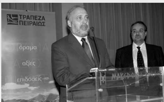
Ο Υπουργός Μακεδονίας Θράκης κ. Γ. Καλαντζής και ο Πρόεδρος του ΣΒΒΕ κ. Γ. Μυλωνάς κατά τη διάρκεια του χαιρετισμού τους

Με μεγάλη επιτυχία πραγματοποιήθηκε, τη Δευτέρα 15 Ιανουαρίου, στο Ξενοδοχείο Μακεδονία Παλλάς, η καθιερωμένη Δεξίωση που παραθέτει κάθε χρόνο ο Σύνδεσμος προς τιμήν των μελών του με την ευκαιρία του νέου έτους. Εκ μέρους του Διοικητικού Συμβουλίου του ΣΒΒΕ ο Πρόεδρος κ. Γ. Μυλωνάς ευχαρίστησε τους επισταμένους για τις ειλικρινείς τους ευχές για τον καινούργιο χρόνο τους Υπουργούς, τους Βουλευτές καθώς και τους εκπροσώπους της Τοπικής Αυτοδιοίκησης, του Προξενικού Σώματος, των Πανεπιστημίων, των Επαγγελματικών, Κοινωνικών και Πολιτιστικών φορέων της Βόρειας Ελλάδας και των Μέσων Μαζικής Ενημέρωσης που τίμησαν με την παρουσία τους στη δεξίωση του Συνδέσμου. Παράλληλα ευχαρίστησε θερμά για την ευγενική χορηγία και υποστήριξη της στη διοργάνωση της δεξίωσης, την ΤΡΑΠΕΖΑ ΠΕΙΡΑΙΩΣ ΑΕ και την AEGEAN AIRLINES ΑΕ. Τα τυχερά μέλη της βραδιάς, τα οποία κέρδισαν αεροπορικά εισιτήρια business class, προσφορά της Aegean Airlines, ήταν οι εταιρείες ΚΡΙ – ΚΡΙ ΑΒΕΕ, ΜΙΧΑΗΛ ΑΡΑΜΠΑΤΖΗΣ ΑΒΕΕ και Κ. ΜΥΛΩΝΑΣ ΑΕΑΠ. ♦