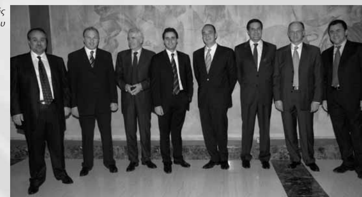
Τα μέλη της Διοικητικής Επιτροπής του Συνδέσμου