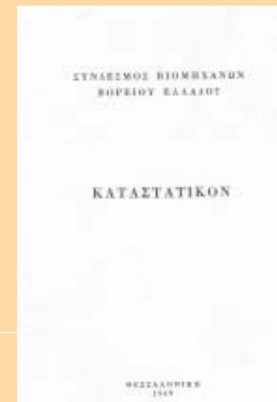
ΣΥΝΔΕΣΜΟΣ ΒΙΟΜΗΧΑΝΩΝ ΒΟΡΕΙΟΥ ΕΛΛΑΔΟΣ (1968 – 1983)