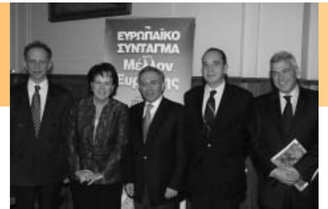
Διακρίνονται από αριστερά ο κ. Η. Κουσκουβέλης, Αντιπρύτανης Πανεπιστημίου Μακεδονίας, η κα Α. Παναγιωταρέα, Δημοσιογράφος και Αν. Καθηγήτρια ΜΜΕ του ΑΠΘ, ο κ. Γ. Βαληνάκης, Υφυπουργός Εξωτερικών, ο κ. Γ. Σταύρου, Εκτελεστικός Αντιπρόεδρος ΣΒΒΕ και ο κ. Δ. Δημητριάδης Αντιπρόεδρος ΕΟΚΕ

Πρόσθεσε επίσης ότι, άμεσες μεταρρυθμίσεις στους τομείς της οικονομίας, της δημοσιονομικής προσαρμογής, της ανασύστασης της λει-