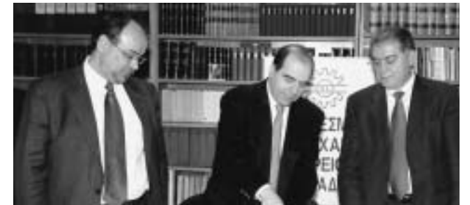
Στιγμιότυπο από την κοπή της πίτας του Διοικητικού Συμβουλίου