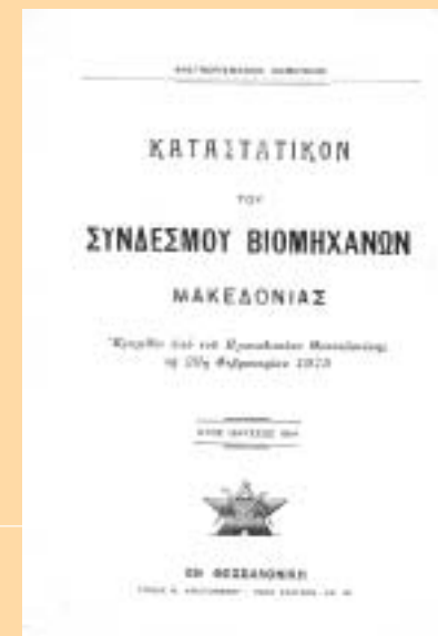
ΣΥΝΔΕΣΜΟΣ ΒΙΟΜΗΧΑΝΩΝ ΜΑΚΕΔΟΝΙΑΣ (1915 – 1938)

Τέλος, οι επετειακές εκδηλώσεις θα ολοκληρωθούν το Φεβρουάριο του 2006, με πανηγυρική μουσική εκδήλωση στο Μέγαρο Μουσικής Θεσσαλονίκης.