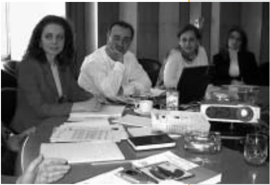
Στιγμιότυπο από τη συνάντηση